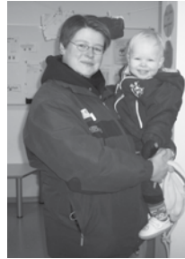
Seit einem Jahr in der Krippe.