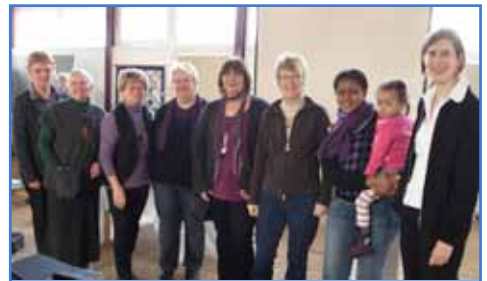
„5 Jahre Begegnungsstätte“ Das Vorbereitungsteam lädt zum Gottesdienst