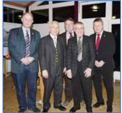
Wissenschaft trifft Kirche Vortragsreihe in Kooperation mit dem Lions Club