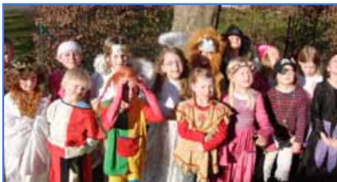
Singschulkinder feiern Fasching